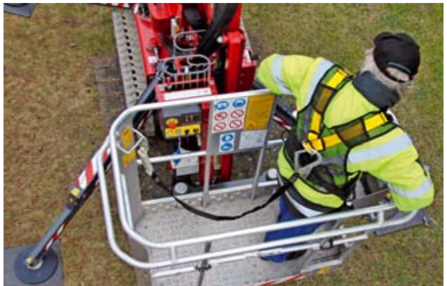
Abb. 2: Verbindungsmittel mit integriertem Falldämpfer sind nicht als Absturzsicherung auf mobilen Hubarbeitsbühnen geeignet.

Seil wird er unter Umständen trotz Sicherung aus dem Korb herausgeschleudert und fügt sich beim Anprall am Korbgeländer oder Ausleger schwere Verletzungen zu. Die bei einem Absturz auftretenden Fangkräfte werden ungedämpft in die Konstruktion der Arbeitsbühne eingeleitet, was deren Standsicherheit gefährden kann. Eine Empfehlung der Unfallversicherer sieht bei der Benutzung von einstellbaren Halteseilen auf Hubarbeitsbühnen ein zusätzliches energieabsorbieren-