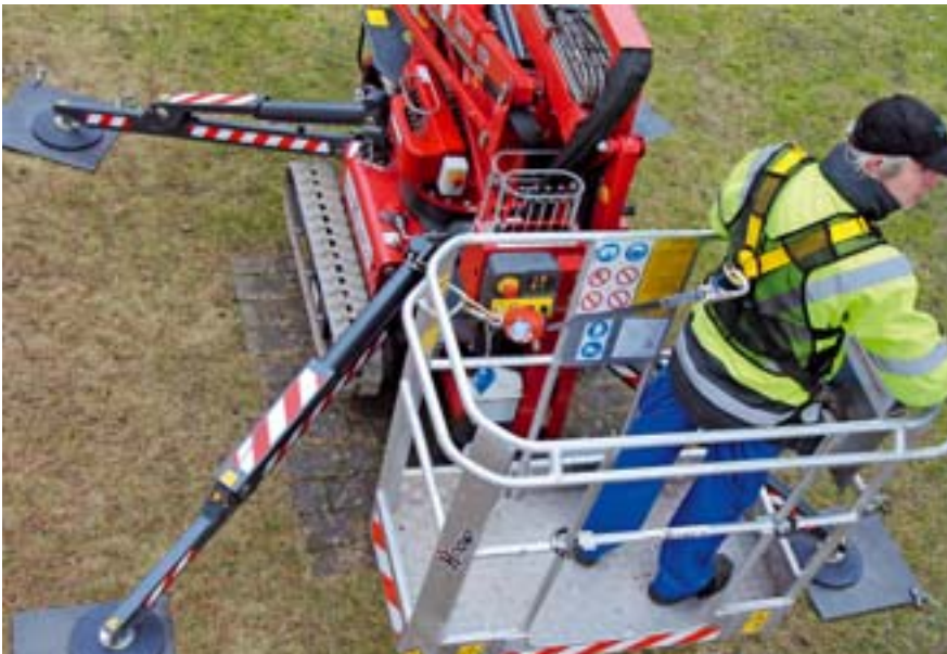
Abb. 3: Bei Höhensicherungsgeräten wird nur die Länge Gurtband aus dem Gerät gezogen, die gerade benötigt wird.