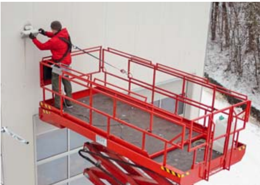
Abb. 4: Besonders in großen Arbeitskörben ist das Höhensicherungsgerät das optimale Sicherungsmittel.

Ältere Bühnen sind entsprechend nachzurüsten. Um auch bei heftigen Korbbewegungen ein Herausschleudern aus dem Korb zu verhindern, ist es sinnvoll, den Anschlagpunkt im Korb möglichst tief zu wählen. Es dürfen jedoch nur zugelassene Anschlagpunkte nach Vorgaben des Herstellers verwendet werden.